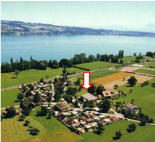
Camping Nottwil am Sempachersee